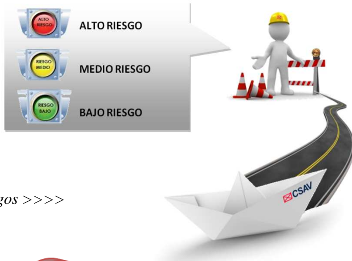
Figura n° 2: Tipo de Riesgos >>>>

La probabilidad contiene 5 niveles: Alto, alto-medio, medio, medio-bajo y bajo. El impacto contiene cuatro tramos: 0 a US$ 30.000, US$ 30.000 a 300.000; US$ 300.000 a US$ 3 millones, y sobre los US$ 3 millones.