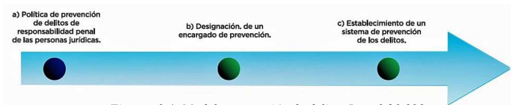
Figura n° 4: Modelo prevención de delitos Ley n° 20.393

La expresión funcionario público incluye jueces, peritos, personeros del poder judicial, funcionarios del poder ejecutivo, legislativo, de la administración municipal, comunal y de organismos fiscales del Estado, de la administración autónoma (Contraloría General de la República, Banco Central, etc.) de las Fuerzas Armadas, Embajadores, Cónsules y agentes acreditados de entidades estatales, gobiernos, organismos internacionales o supranacionales, organismos no gubernamentales (ONG) y de toda entidad estatal, así como los funcionarios públicos extranjeros o quienes trabajen para las antedichas autoridades y organismos.