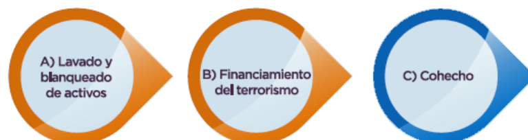
Figura n° 1: Responsabilidad de las personas jurídicas

Este Manual de Organización, Administración y Supervisión (MOAS) ordena y expone el modelo de organización, administración y supervisión de la Compañía Sud Americana de Vapores S.A., sólo en lo que a los delitos de lavado de activo, financiamiento del terrorismo y cohecho se refieren.